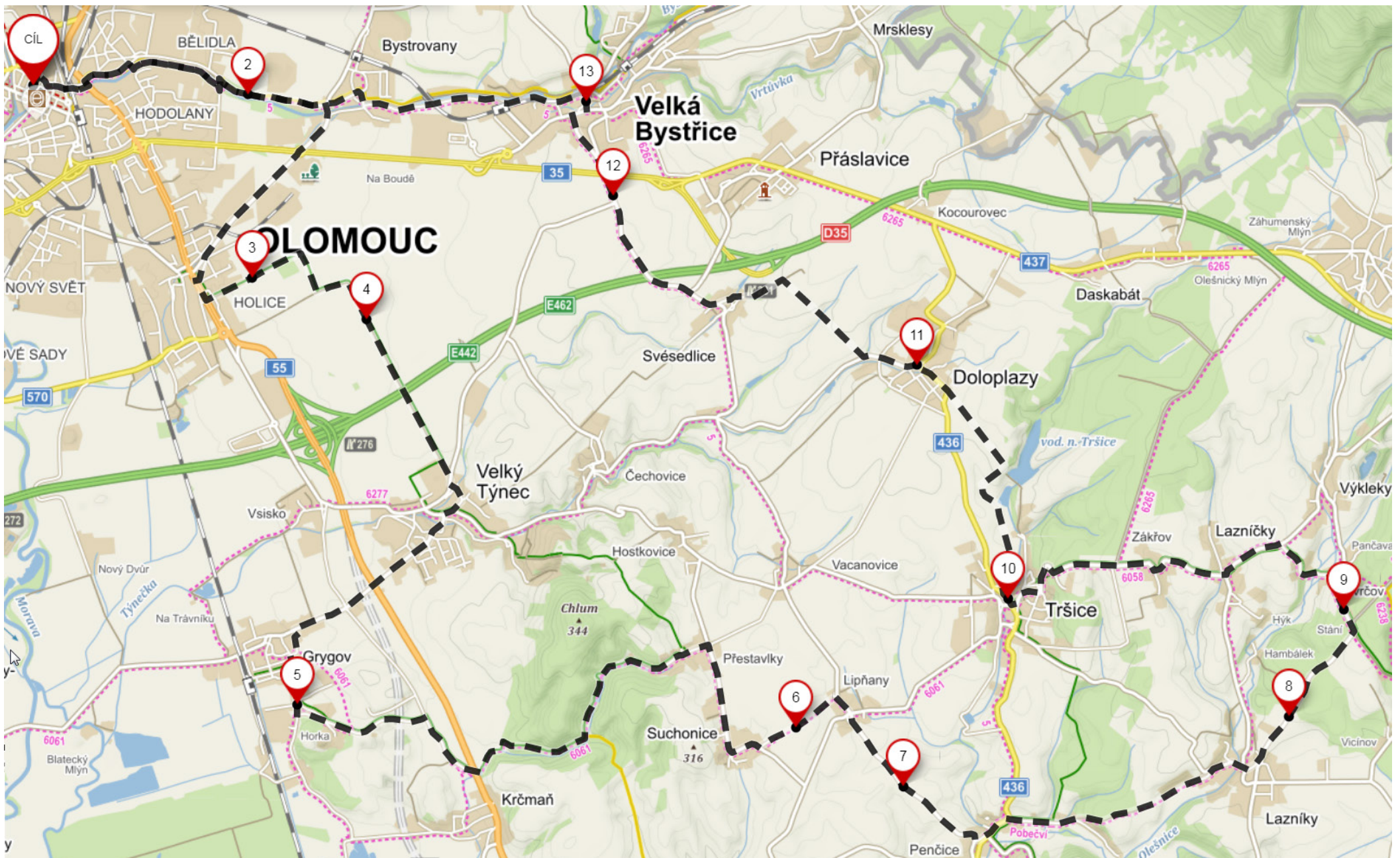
Lazníčky – větrný mlýn