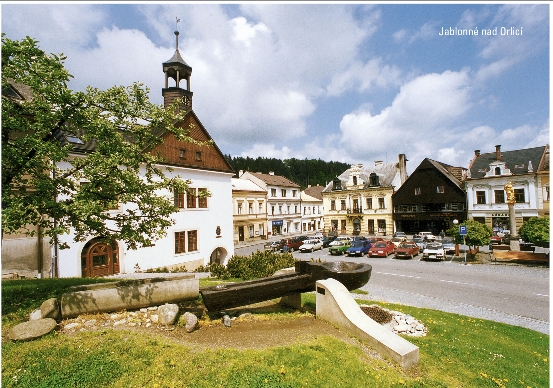
Jablonné nad Orlicí