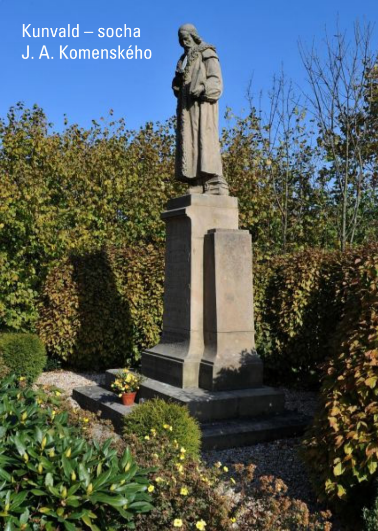
Kunvald – socha J. A. Komenského