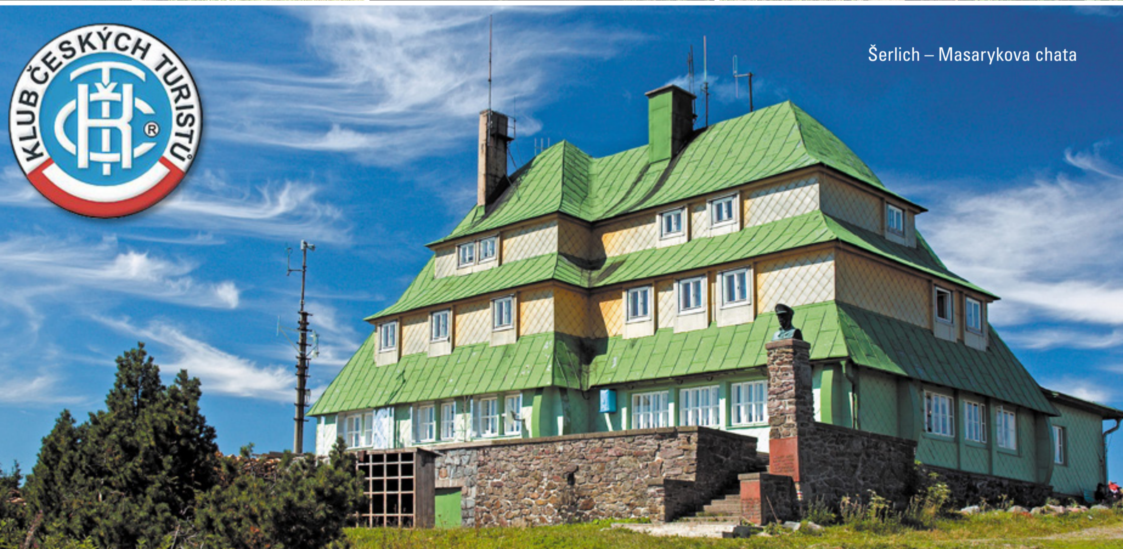
Šerlich – Masarykova chata